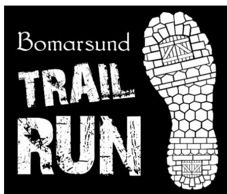
Evenemangets nya logo