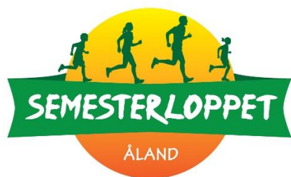
Evenemangets nya logo