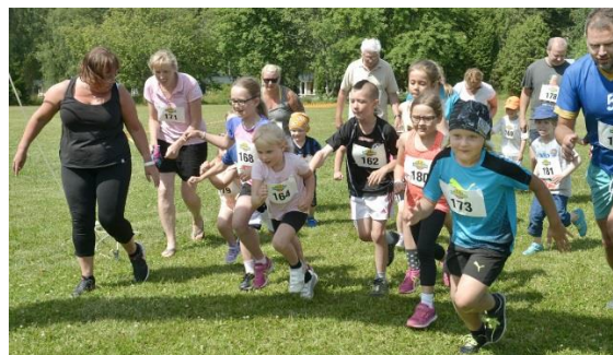
Start för 1km