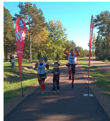
Glada SPRINT-deltagare i mål