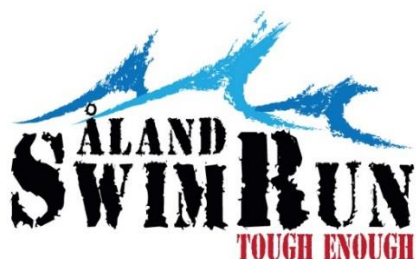
Evenemangets nya logo

var 24 stycken. Förhandsanmälda var aningen flera, men p.g.a. olika orsaker uteblev en del lag i sista stund. Loppet, som genomfördes i strålande solsken och klart, lugnt vatten fick positiv feedback av deltagarna och kommer att bli ett återkommenade inslag i den åländska sporthösten.