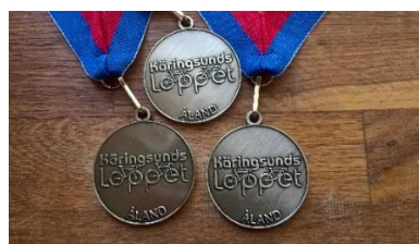
....och nya medaljer!