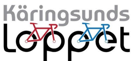
Evenemangets nya logo...