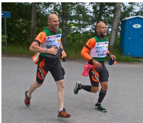
Team ÅTRI, Porkkala Swimrun 23.7.2016